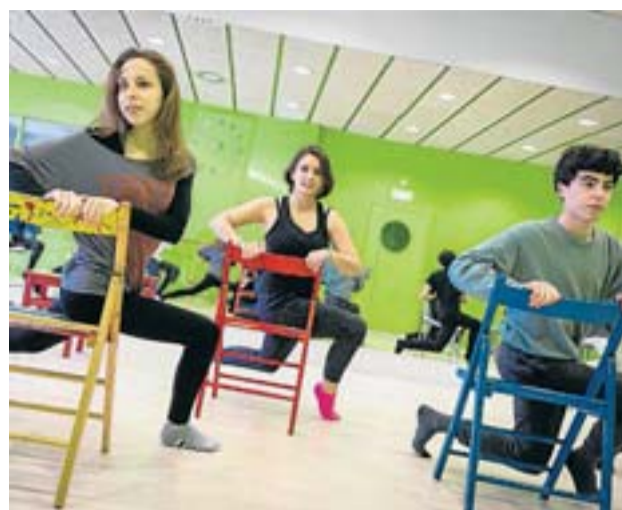
BALL. El llenguatge de la dansa pot aportar molts beneficis, tant a nivell educatiu com emocional.